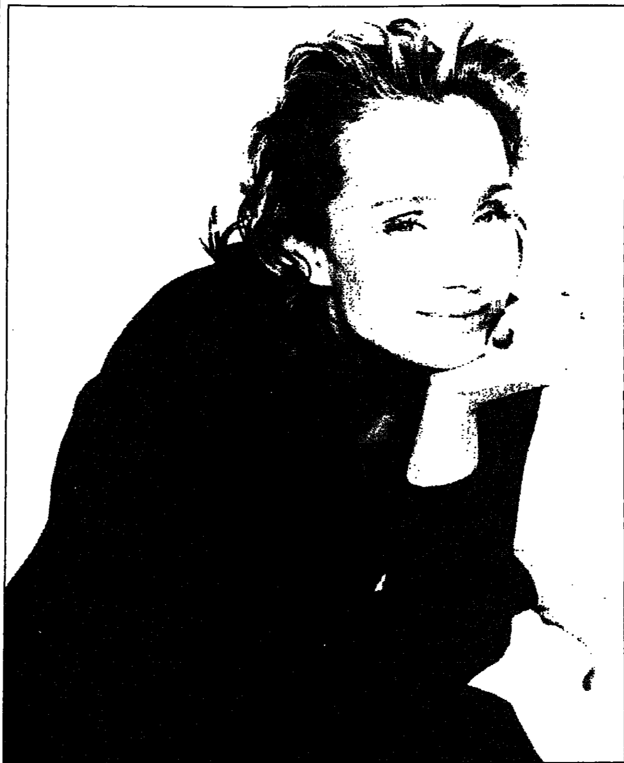
المثلة كريستين سكوت توماس